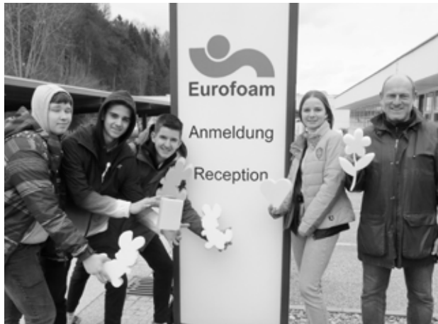
Nach dem Besuch in der Eurofoam