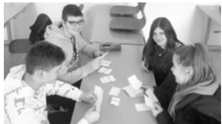
Beim Ausprobieren der selbst gestalteten Lernspiele