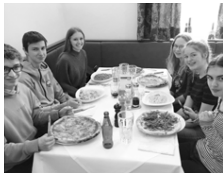
Nach der Exkursion gab es natürlich Pizza und Pasta.