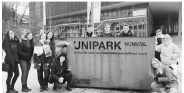
Die Spanisch-WPG-Gruppe in Salzburg