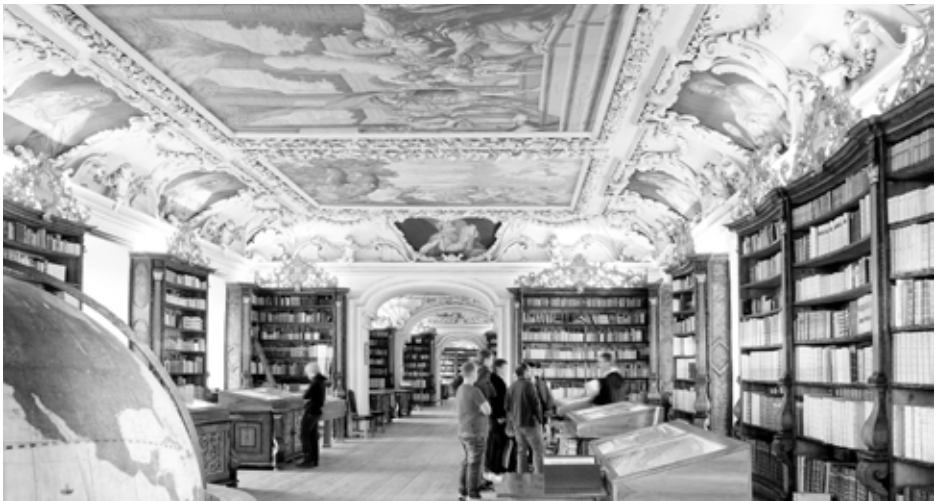
In der Stiftsbibliothek

Besuch der Stiftsbibliothek, kunstvolle Initialen in der Schreibschule selbst gestalten