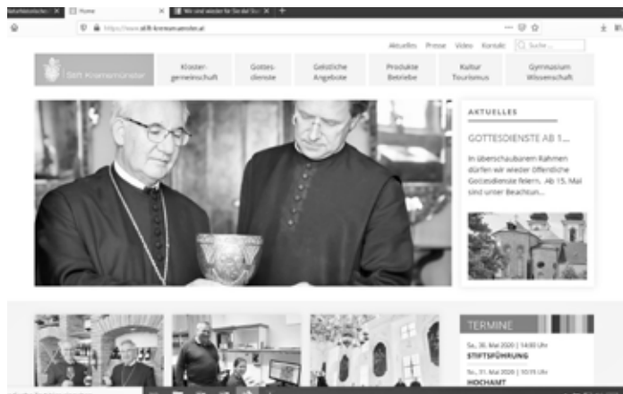
Ein Blick auf die neue Website