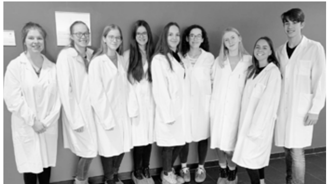
Die Schülerinnen und Schüler der BU-WPG-Gruppe

In zwei Jahren sollten wir diese Exkursion