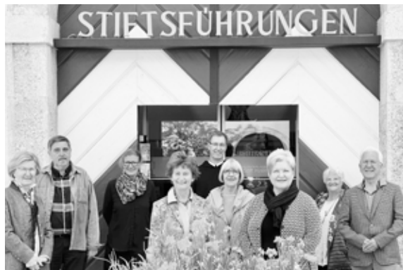
Das Team der Stiftsführungen

Ab Dienstag, 30. Juni finden täglich Stiftsführungen um 11:30 und 14 Uhr statt. Die Sternwarte kann um 10 Uhr und 14 Uhr besucht werden. Montag ist Ruhetag.