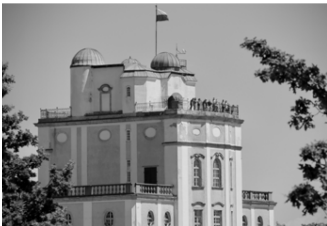
Ein herrlicher Ausblick von der Terrasse der Sternwarte

Jeden Sonntag in den Ferien besuchen wir eine besondere Schule: Die Schreibschule und 230.000 Bücher lassen sich in der Bibliothek erkunden. Kunstvolle Initialen werden selbst gemalt und Bücher im wahrsten Sinne des Wortes aufgeschlagen. Alle Programmpunkte sind interaktiv und laden zum Mitmachen ein. Bewegung und Spaß kommen nicht zu kurz. Alle Eltern und Großeltern sind dazu herzlich eingeladen. Treffpunkt: Klosterladen