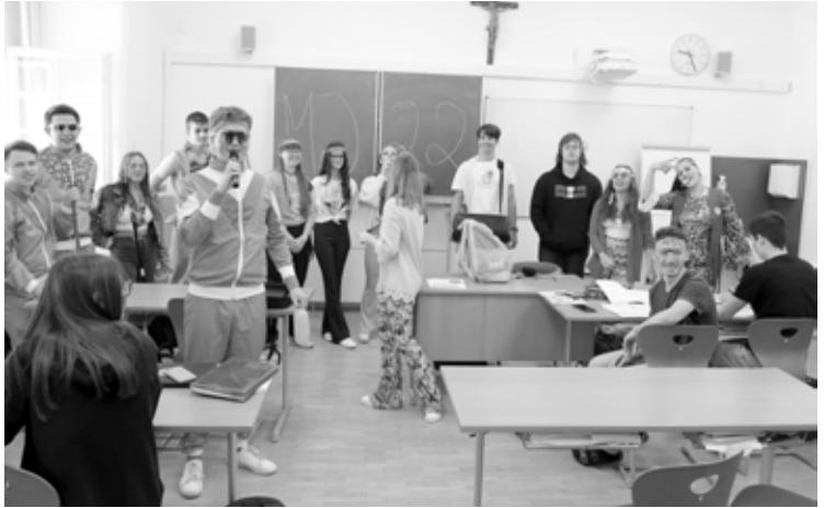
Beim Verabschieden in der 7B

in eher heiteren und unorthodoxen Disziplinen zu prüfen. Es galt, Dinge pantomimisch darzustellen, Kreidemalereien zu erraten, Schwedenbomben um die Wette zu essen u. v. m. Auch die Lehrkräfte wurden nicht verschont und