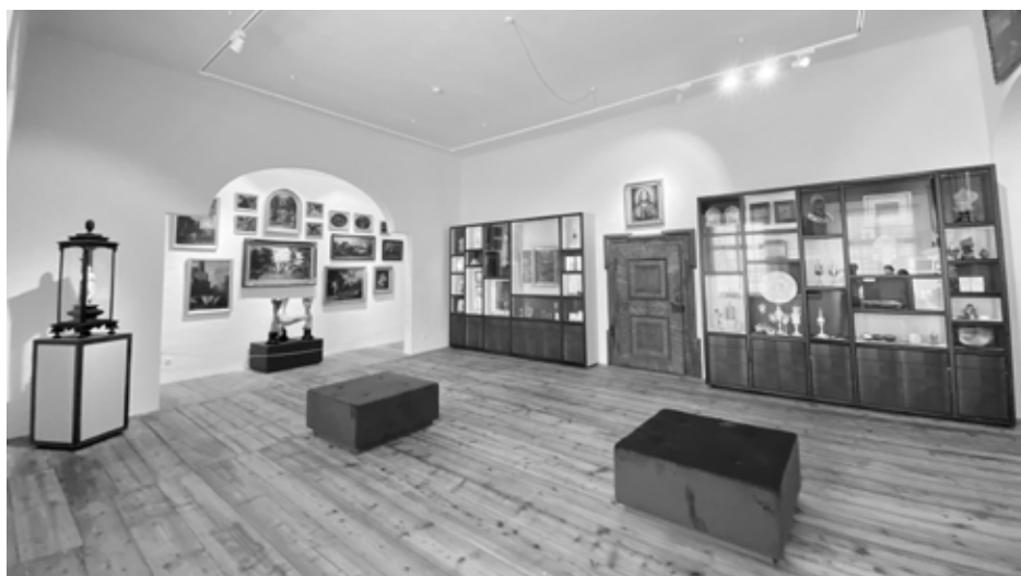
In der neu aufgestellten Wunderkammer

Im Rahmen einer Stiftsführung von Dienstag bis Sonntag, jeweils um 11:30 und 14:00 Uhr oder auf Anfrage an tourismus@stift-kremsmuenster.at , Tel.: 07583/5275-151. Beginn der Führung ist im Klosterladen.