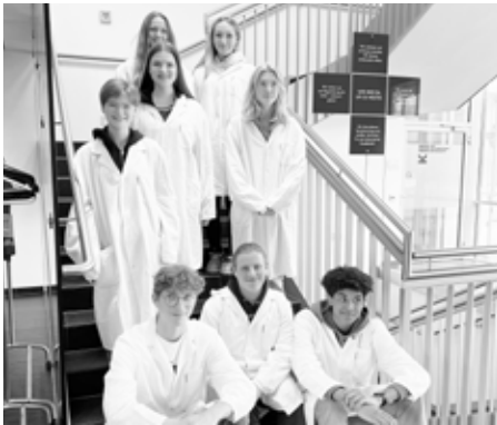
Die WPG-Gruppe in der Blutzentrale

Trotz großer Nachfrage bekamen wir heuer doch noch die Möglichkeit, im Rahmen des Bio-Wahlpflichtgegenstandes die Blutzentrale in Linz zu besuchen.