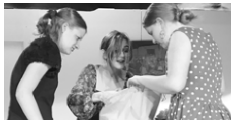
Die drei Schwestern finden den Geldsack