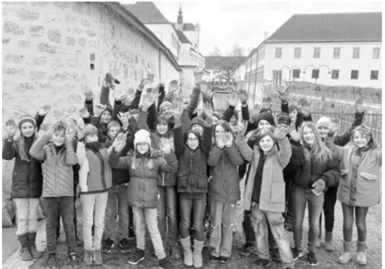
Die 1A nach zweistündigem Sammeln im Stiftsgelände

Auch heuer beteiligte sich das Stiftsgymnasium Kremsmünster wieder mit den drei ersten Klassen an der landesweiten Anti-Littering-Kampagne „Hui statt Pfui“ der OÖ Umwelt Profis. Dankeswerterweise übernimmt die Gemeinde Kremsmünster