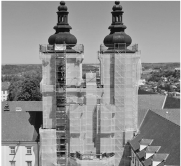
Die vollständig eingerüstete Westfassade

Alexandra Hauzenberger, Kommunikationsbüro