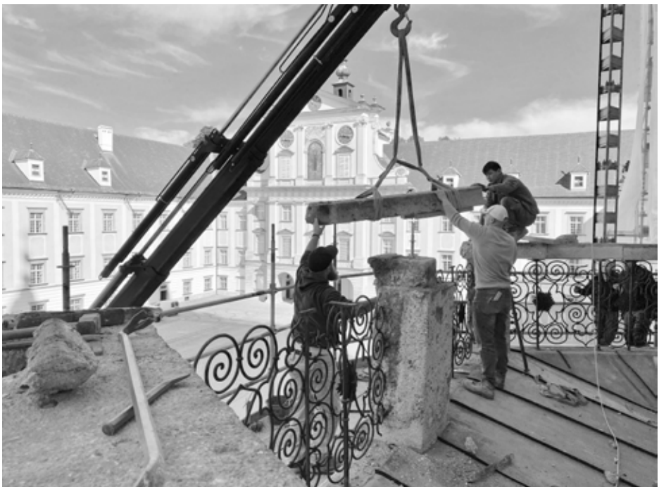
Arbeiten in luftiger Höhe