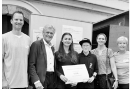
Preisübergabe an die 4B

Die Marktgemeinde Kremsmünster bedankt sich gemeinsam mit der Gruppe „Aktiv bewegt“ herzlich bei allen Schülerinnen und Schülern, die sich zu diesem wichtigen Thema Gedanken gemacht und mitgemacht haben. Herzliche Gratulation an die fünf Gewinnerklassen zu ihrem Gewinn von jeweils € 250,- für die Klassenkasse. Was werden die Schülerinnen und Schüler mit