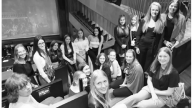
Vor Beginn der Aufführung