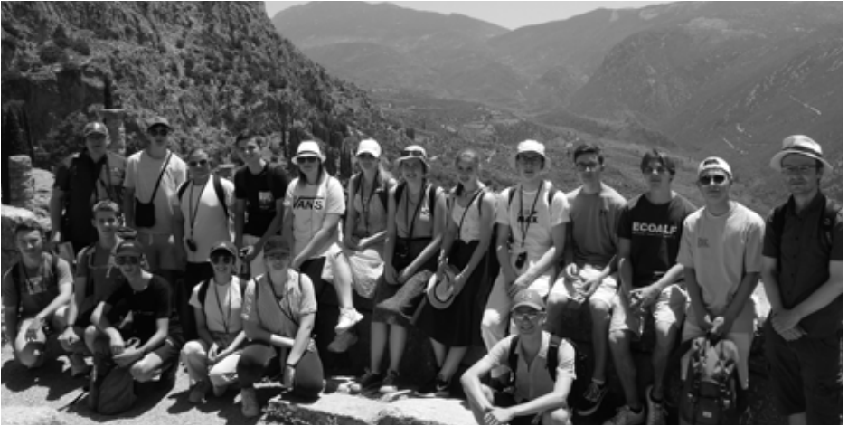
Gruppenfoto in Delphi mit den Teilnehmerinnen und Teilnehmern vom Akademischen Gymnasium in Linz