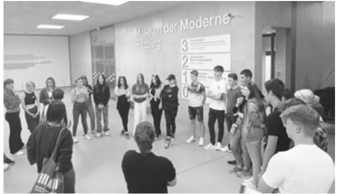
7A und 7B im Museum der Moderne

Ausstellung „True Pictures? Zeitgenössische Fotografie aus Kanada und den USA“ im Rahmen einer Führung mit Kunstgespräch und kleinem Workshop erleben konnten. Die groß angelegte Ausstellung reagiert auf den Umstand, dass die künstlerische Fotografie in Europa ab den 1980er-Jahren eigenständige Wege einschlug, indem sie mit einem offeneren Blick die nordamerikanische Fotografie der Gegenwart vorstellt. Analog zur künstlerischen Emanzipation der Fotografie in Europa identifiziert die Ausstellung die ausgehenden 1970er-Jahre als Ausgangspunkt eines grundlegenden