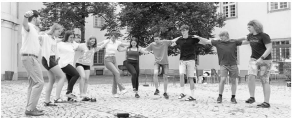
Sirtaki im Agapitushof