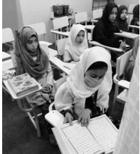
Beim Lernen in der neuen Mädchenschule