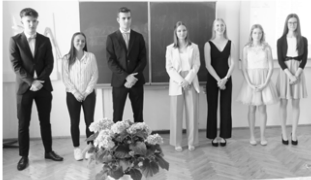
Ein Teil der Maturantinnen und Maturanten bei der Verkündung der Noten.

Die Maturantinnen und Maturanten der 8A und 8B hatten sich intensiv mit Fragestellungen aus verschiedensten Bereichen auseinandergesetzt. In sehr ansprechenden und informativen Präsentationen konnten Kommission (Direktor, Klassenvorständin/Klassenvorstand, Betreuerin/Betreuer) und Publikum daher allerlei Interessantes über Themen aus Biologie, Psychologie, Gesundheit, Musik, Wirtschaft, Sport, Literatur, Ethik und Linguistik erfahren. In den anschließenden Diskussionen stellten