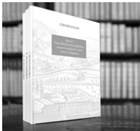
Cremifanum: Band I bis III

Kontakt für Bestellungen: buchhandlung@stift-kremsmuenster.at