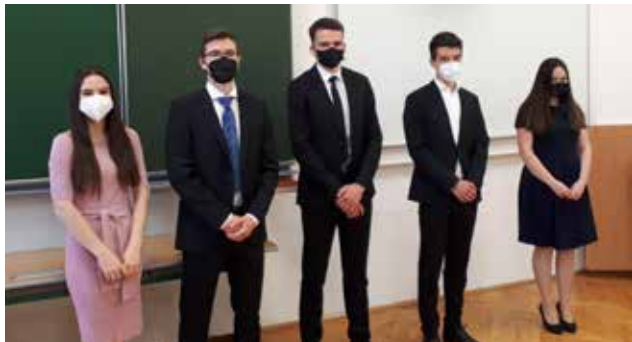
Die Kandidatinnen und Kandidaten bei der freiwilligen VWA-Präsentation

Konvikts als gut geeignete Räumlichkeit anbot. Damit zählte die 8. Klasse nicht zur 50 %-Quote im Schulbereich und konnte vier Tage in der Woche von ihren Professorinnen und Professoren face-to-face betreut werden. Rückblickend gesehen war das eine sehr sinnvolle Maßnahme.