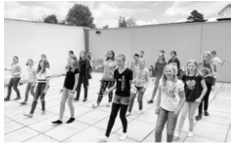
Im kleinen Hof beim Musikzimmer 1