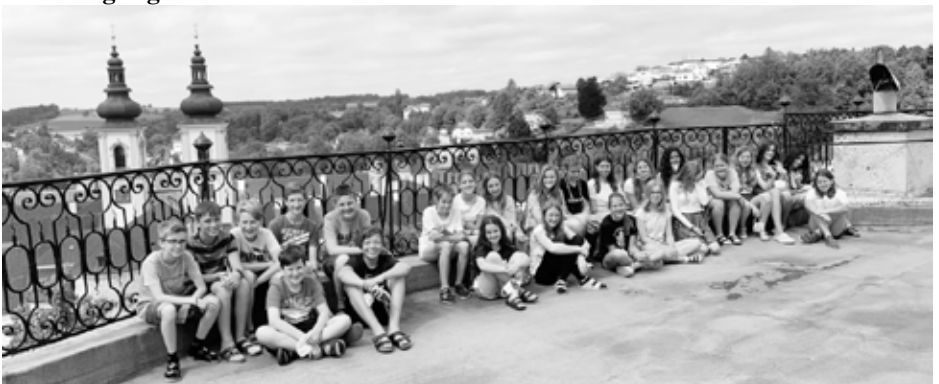
Auf der Aussichtsterrasse der Sternwarte