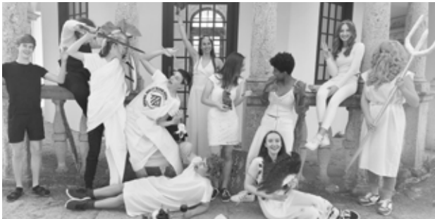
Fotoshooting beim Gartenpavillon

Erstmalig verkleideten sich die Griechisch-Schülerinnen und Schüler der 5. Klassen als griechische Götter und verlegten den Olymp für eine Stunde nach Kremsmünster.