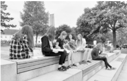
Auf den Sitzstufen vor der Schule