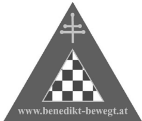
Logo: BENENEDIKT be-WEG-t OÖ

Text auf Basis von Informationen des Vereins BENEDIKT be-WEG-t Oberösterreich