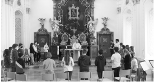
Bei einem der Gottesdienste in der Akademischen Kapelle

Bei den klassenweisen Feiern in unserer schönen Akademischen Kapelle, bei denen neben den Religionslehrkräften auch die jeweiligen Klassenvorstände dabei waren, stand vor allem die Dankbarkeit im Vordergrund. Denn selbst so etwas „Banales“ wie „fünf Tage die Woche gemeinsam in der Klasse zu sein“ war nicht selbstverständlich. Umso spürbarer war die Freude, wieder miteinander Messe feiern zu können. Hesse spricht in seinem Gedicht vom Zauber, „der uns beschützt und der uns hilft zu leben.“ Dementsprechend wurden