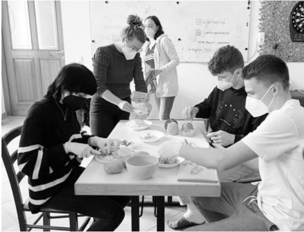
Beim Kochen im j@m

J@ms ein. In einer kurzen Besprechung wurden die Aufgaben verteilt und dann ging es los! Schon bald bot sich ein herrliches Bild: Es hätten auch die Weltmeisterschaften im Gemüseschneiden sein können, denn kaum einmal wurde in so kurzer Zeit so viel Gemüse verarbeitet! Tomates, pimientos, zanahorias, calabacines y cebolla wurden perfekt klein geschnitten und neben einer Fleischfüllung als vegane Alternative mit Bohnen zubereitet. Zwischendurch gab es nachos zur Stärkung und die alumnos