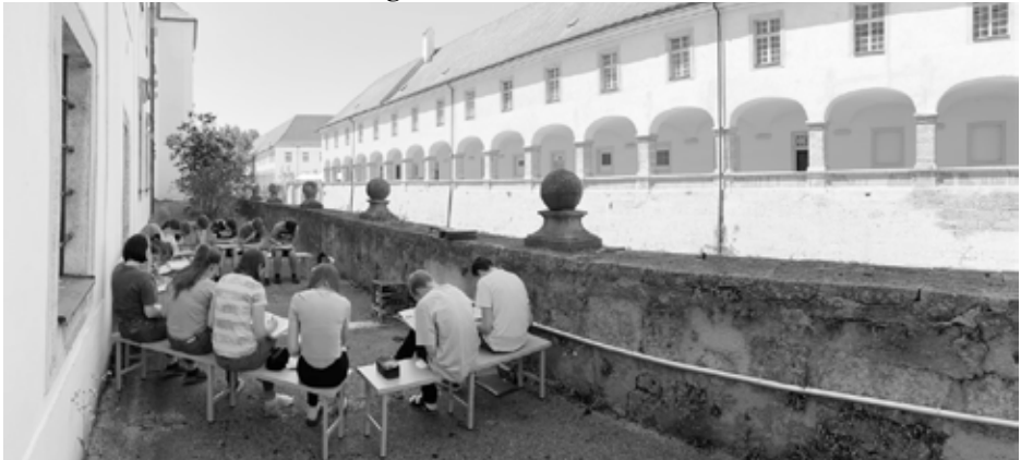
Beim Musikzimmer 1 am Wassergraben