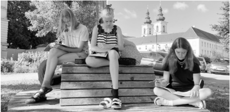
Vor der Schule auf den Holzliegen