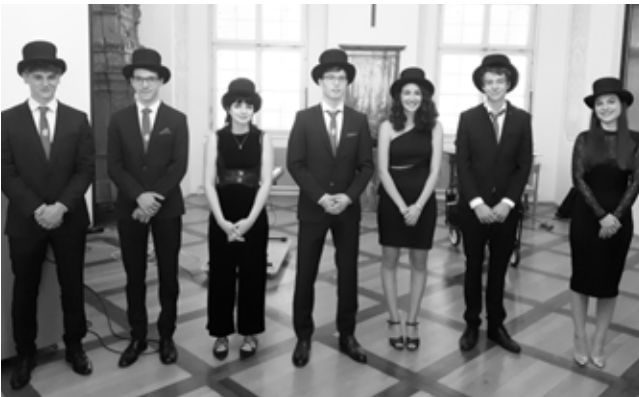
Bei der Notenbekanntgabe am Ende der freiwilligen mündlichen Reifeprüfung

Am 23. Juni fand dann die feierliche Verab-